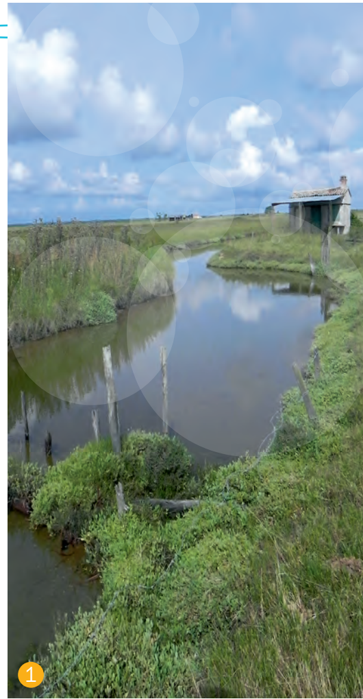
1 Fossé à poissons

→ PLUS D'INFOS SUR : http://www.migrateurs-charenteseudre.fr/actualites/