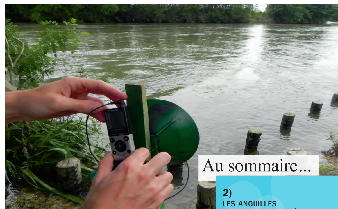
Enregistreur audio sur une frayère d'aloses

La Cellule Migrateurs réalise depuis 2009 un suivi des reproductions d'aloses. Pour évaluer l'état du stock sur le bassin Charente, il est primordial d'avoir une estimation du nombre de géniteurs.