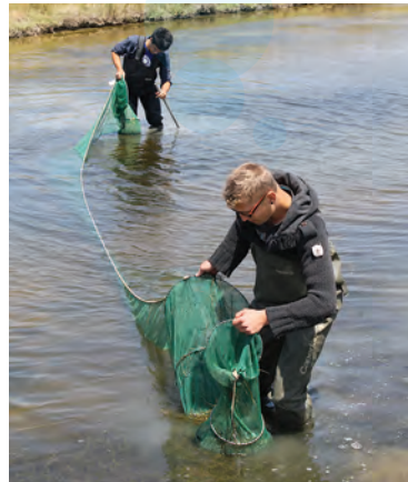
Relève d'un verveux

Ce projet de réhabilitation est voué à continuer dans les années à venir. Quant au suivi de l'anguille, la cellule poursuivra son travail sur des fossés représentatifs de l'ensemble du marais salé pour alimenter le tableau de bord Anguille Seudre, outil d'aide à la gestion de l'espèce.