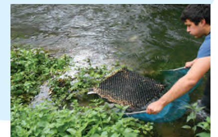
Relève d'un flottang

Le flottang, piège sélectif et attractif, répond aux objectifs de capture. Il est pratique, standardisé, simple d'utilisation et d'entretien et donc facilement reproductible sur de nombreux sites. Il a été choisi pour un test à grande échelle sur l'ensemble de la Charente afin de déterminer le front de colonisation des anguilles. Des tests en marais salés, en aval et en amont d'ouvrage de marais doux ont été réalisés. Les résultats sont encourageants et les expérimentations devraient être poursuivies en 2015. Pour avoir accès à l'ensemble des résultats, télécharger le rapport sur : www.fleuve-charente.net/bibliotheque