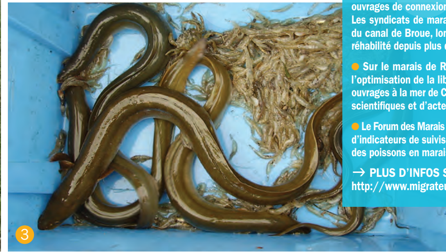
2 Prise d'eau 3 Anguilles et crevettes de marais