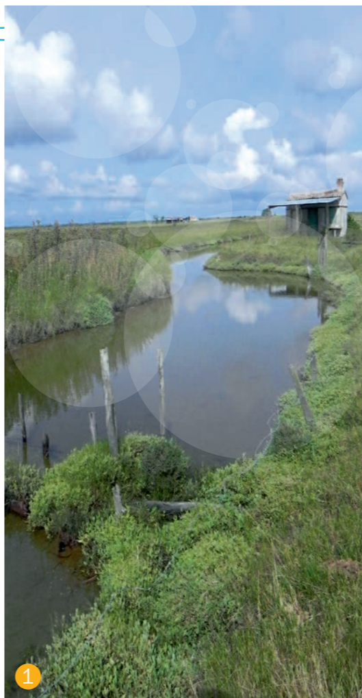
1 Fossé à poissons