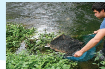
Relève d'un flottang

Le flottang, piège sélectif et attractif, répond aux objectifs de capture. Il est pratique, standardisé, simple d'utilisation et d'entretien et donc facilement reproductible sur de nombreux sites. Il a été choisi pour un test à grande échelle sur l'ensemble de la Charente afin de déterminer le front de colonisation des anguilles. Des tests en marais salés, en aval et en amont d'ouvrage de marais doux ont été réalisés. Les résultats sont encourageants et les expérimentations devraient être poursuivies en 2015. Pour avoir accès à l'ensemble des résultats, télécharger le rapport sur : www.fleuve-charente.net/bibliotheque