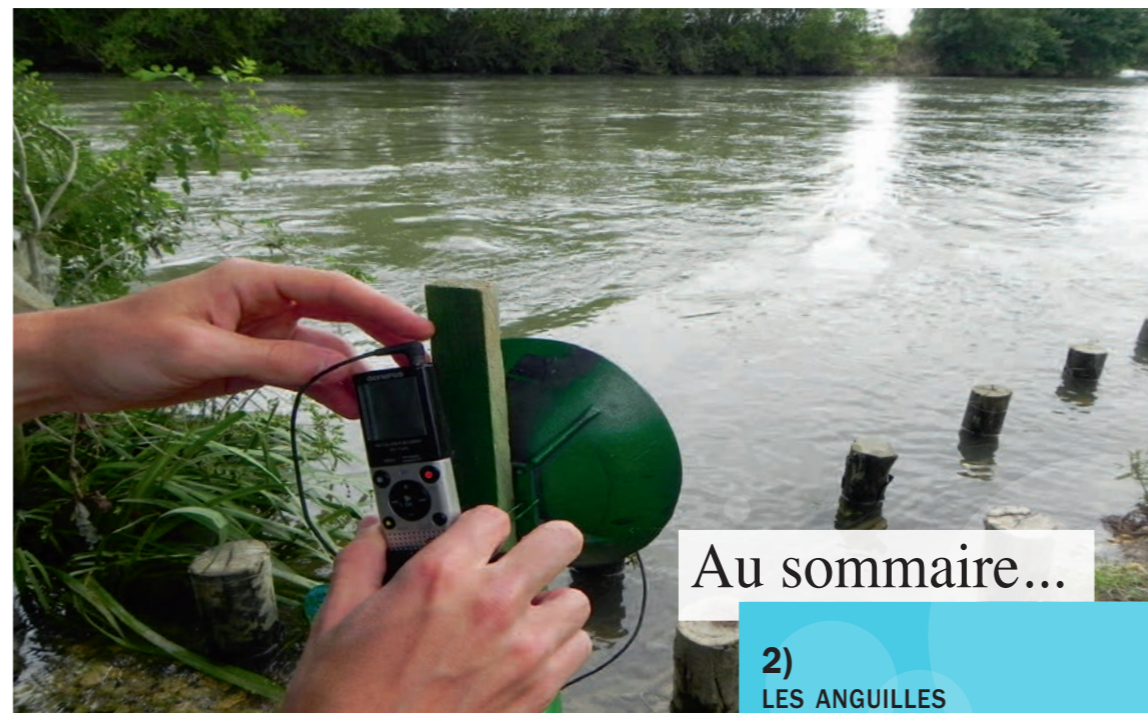
Enregistreur audio sur une frayère d'aloses

Pour répondre à cet objectif, 24 nuits et 80 agents ont été nécessaires. Les poses-relèves des enregistreurs ont nécessité 30 heures et le dépouillement a été effectué en 133 heures. Les résultats montrent la difficulté d'estimer le nombre global de géniteurs sur le bassin versant, à cause du manque de précision des suivis